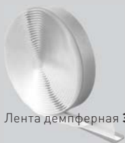
Лента демпферная Энергофлекс™ Супер